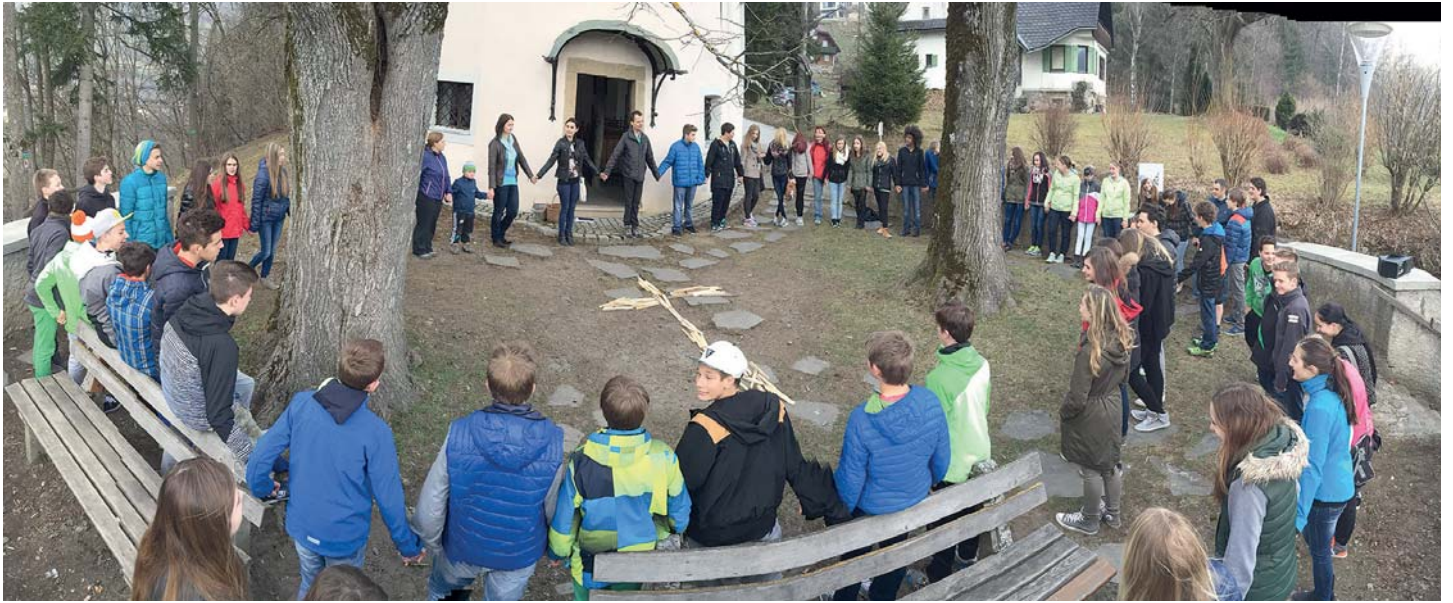
Kreuzweg und Bußandacht mit den FirmkandidatInnen aus unserem Pfarrverband von der Pfarrkirche Liezen zur Kalvarienberg-Kapelle.