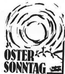
Tag des Sieges, Tag der Freude, Nicht mehr endendes Licht