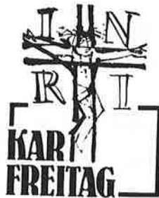
Tag der Schmerzen, Tag der Verlassenheit, Tag des Gerichtes

Strenger Fasttag: alle kath. Christen verzichten auf Fleischspeisen, die Erwachsenen nehmen nur eine sättigende Mahlzeit zu sich.