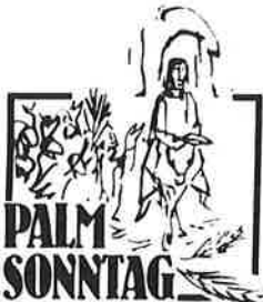
Tag des Jubels, Tag der Begeisterung, Tag der falschen Schwüre

Am Palmsonntag kann in der Pfarre noch das Fastenopfer an den Kirchtüren ins Körbchen gelegt bzw. das Fastenglas abgegeben werden.