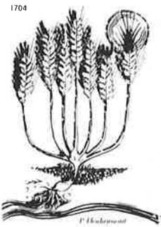
Das Weizenkorn muß sterben, sonst bleibt es ja allein; der eine lebt vom andern, für sich kann keiner sein.

Tag der Grabesruhe Jesu; das heilige Grab steht von 8.00 – 17.00 Uhr offen zur Verehrung. 15.30 – 16.30 Uhr: Anbetung des Allerheiligsten in der Eucharistie auf dem Tabernakel im Altarraum des Hauptschiffes.