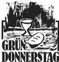
Tag des Mahles, Tag der Liebe, Tag des Verrates

Zum letzten Mahl kamen elf Freunde Jesu und sein Verräter. Für alle brach er das Brot. Für alle starb er. Gründonnerstag 1988: Heute kann man kommen oder fernbleiben. Sich an den Tisch setzen oder sich von anderen Tischen nähren. Zur Feier des letzten Abendmahles zu gehen, ist ein Zeichen der Freundschaft zu Jesus.