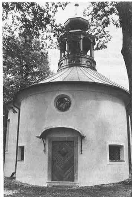
Zu den Bittagen und an zwei Freitagen im Mai (Maiandachten) feiern wir in der Kalvarienbergkirche.

Nächste Ansprechmöglichkeit: 26. 5. 1990, 9 bis 11 Uhr, kath. Pfarramt, Salzstraße 1