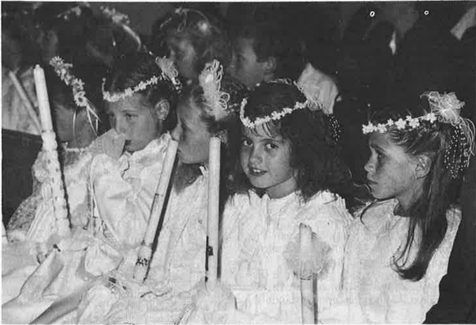
Kinder bei der Erstkommunionfeier 1989 in Weißenbach