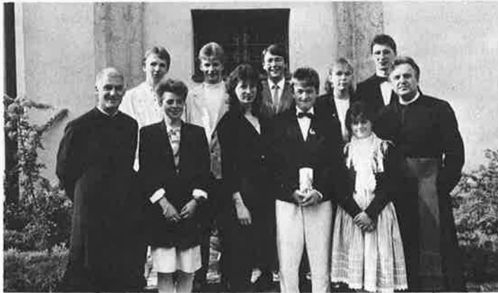
Eine Firmgruppe aus dem Vorjahr