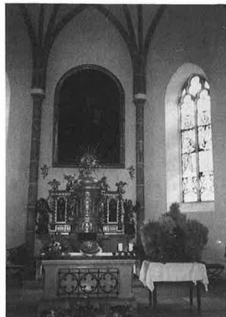
Die Erntekrone und der festlich geschmückte Altar der Pfarrkirche