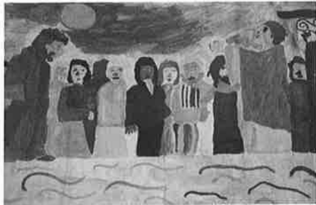
Jesus wird zum Tode verurteilt.

Es sind alle Kinder unserer Pfarre und ihre Begleiter zum Mitfeiern und Mitgehen eingeladen, besonders aber die Erstkommunionkinder dieses Jahres aus Liezen und Weißenbach mit ihren Angehörigen und Tischmüttern.