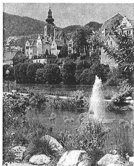
Frohnleiten, im Vordergrund die reizvolle Murpromenade

Fahrtpreis: Erwachsene S 170,- Kinder S 100,-