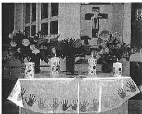
Liebevoll haben die Kinder des Städtischen Kindergartens im Vorjahr den Altar für die Ortssegnung geschmückt: Tischtuch, Kerzen, Blumen, Bilder.

In Liezen und Weissenbach feiern wir Fronleichnam ohne traditionelle oder folkloristische „Zutaten“ wie in anderen Regionen unseres Landes, wo zu Fronleichnam alles an Vereinen mit dabei ist, wo Blumenteppeiche kunstvoll gelegt werden, wo Uniformen von Studentenverbindungen dominieren, wo die örtliche Prominenz unmittelbar hinter dem Baldachin (dem „Him-