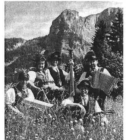
Die Volksmusik Weissenbach gestaltet musikalisch sowohl den Festgottesdienst in der Kirche als auch das außerkirchliche Zusammensein am Kirchplatz.

Mitfeiernde aus dem Pfarrbereich von Liezen sind in Weissenbach immer ebenso herzlich willkommen. – Ihr Mitfeiern des Festgottesdienstes und des außerkirchlichen Festes freut uns sehr!