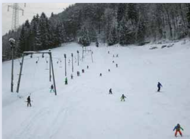
Der Hochbetrieb auf der Bacherleit'n zeigt, wie gerne das zentral gelegene Schiangebot genutzt wird.

maßen rechnet und andererseits die Bevölkerung – besonders unsere Kinder – das Angebot