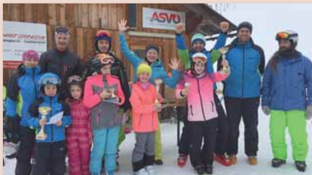
So sehen Sieger aus! Die Kinder samt den Eltern und den Skilehrern hatten viel Spaß.

Ein großes Dankeschön allen Beteiligten für diese gelungenen Schitage und dem Elternverein für die Krapfenjause!