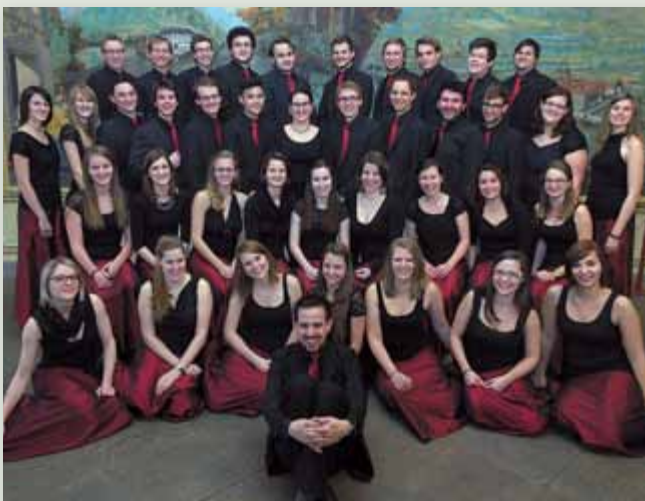
Besonders stolz sind die jungen Sängerinnen und Sänger auf die zahlreichen Preise, die sie bei internationalen Wettbewerben gewinnen konnten.