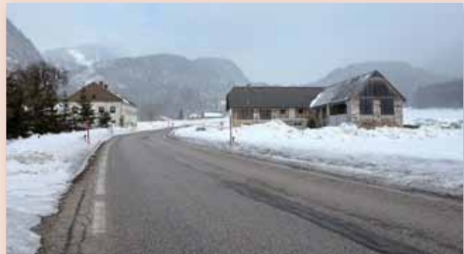
Zur Verbesserung der Verkehrssituation führt die Pyhrnpass-Bundesstraße B 138 zukünftig außerhalb des Gehöftes vlg. Bliem vorbei.

Die Pyhrnpassbundesstraße B 138 wird von der Landesstraßenverwaltung im Sommer 2018 saniert.