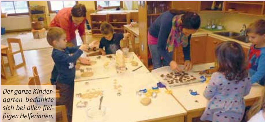
Der ganze Kindergarten bedankte sich bei allen fleißigen Helferinnen.

In der Vorweihnachtszeit durften wir auch heuer wieder auf die Mithilfe einiger Mütter zählen.