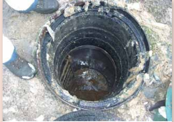
Erst vor kurzem waren die Mitarbeiter des Städtischen Bauhofes im Einsatz, um einen verstopften Kanal zu reinigen.

Neben Windeln, Slipeinlagen und Strumpfhosen sind vor al-