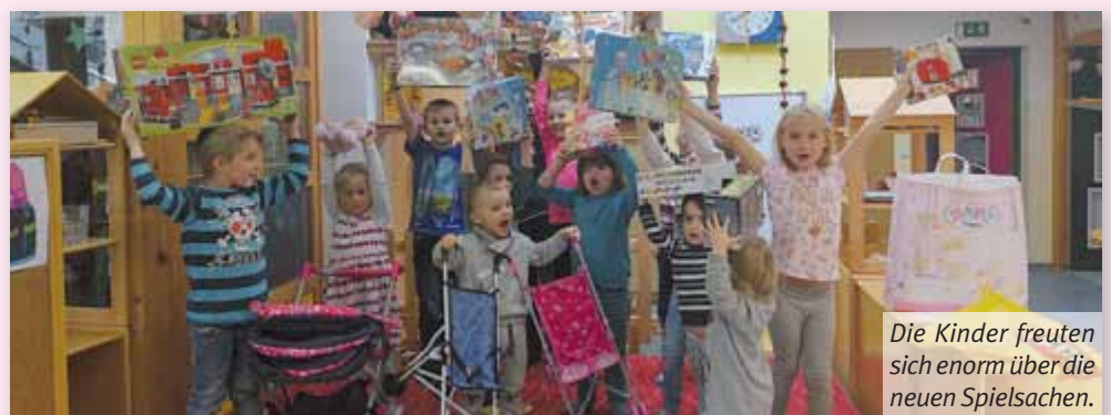
Die Kinder freuten sich enorm über die neuen Spielsachen.