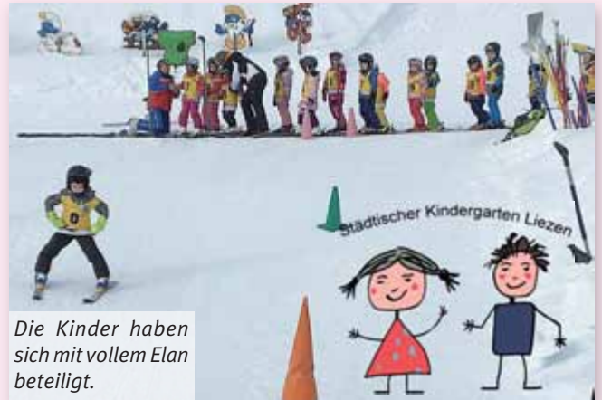
Die Kinder haben sich mit vollem Elan beteiligt.

Ohne die großzügige Unterstützung von Sponsoren sind solche Veranstaltungen nicht möglich, daher gilt ein großer Dank an die Oberösterreichische Versicherung, der Steiermärkischen Sparkasse, der Raiffeisenbank Liezen sowie Merkur, Billa und Eurospar.