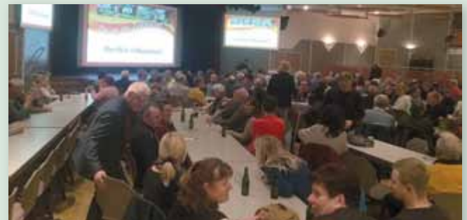
Wieder über 600 Besucher bei der beliebten Vortragsreihe „Liezen – Geschichte und Gegenwart“ im großen Saal des Kulturhauses.

Im Stadtarchiv lagern noch viele Schätze wie z. B. auch historische Filmdokumente, die bereits digitalisiert wurden und auf eine Vorstellung für das Liezener Publikum „warten“.