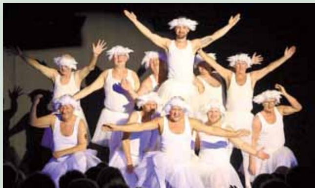
Schwanensee einmal anders – das Männerballett in ihren Tutus sorgte für viele Lacher.