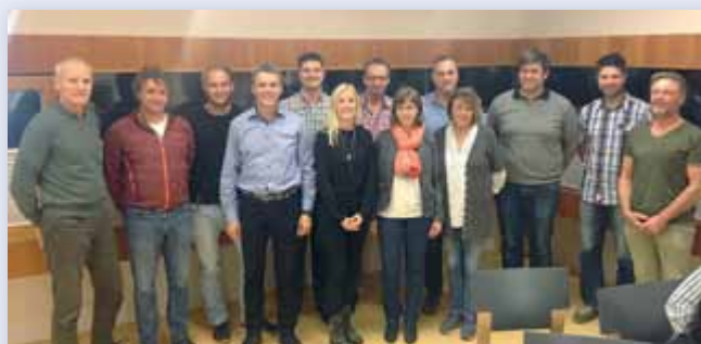
Die Arbeit des gesamten Vereines wurde heuer schon mit zahlreichen perfekten Schitagen und Flutlichtabenden belohnt.

in der kommenden Wintersaison, damit sich einerseits der Aufwand des Schiliftes einiger-