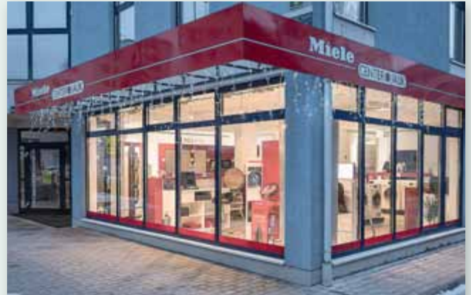
Der Standort Fronleichnamsweg 8 gewährt auch von außen einen tollen Blick in die modern gestaltete Geschäftsfläche.

cher und individueller Beratung. Ob Neueinrichtung, Ersatzteilsuche oder Zubehörkauf, das Team von Miele Center Jauk steht kompetent zur Seite.