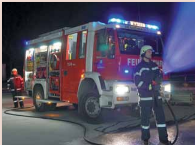
Im Not- und Extremfall für andere da zu sein und zu helfen ist für Feuerwehrmänner und -frauen eine Selbstverständlichkeit.

Zum Schnuppertag der Freiwilligen Feuerwehr Weißenbach am 14. April von 14.00 bis 17.00 Uhr sind alle interessierten Bürgerinnen und Bürger sowie alle Schülerinnen und Schüler herzlich eingeladen!