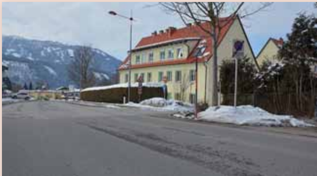
Nach der Generalsanierung des Fronleichnamsweges soll 2018 der angrenzende Bereich der Döllacher Straße von Grund auf saniert werden.

Der Abschnitt der Döllacher Straße zwischen Musikhaus Härtel und der Unterführung der B 320 soll generalsaniert werden.