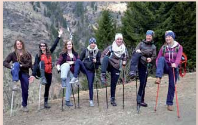
Bei gemeinsamen Aktivitäten wird der Zusammenhalt gestärkt.

Im aktuellen Lehrgang dürfen die Studierenden bereits auf zahlreiche Exkursionen zurückblicken. Sie besuchten das SOS Kinderdorf Stübing, das Vinzidorf, das Odilieninstitut Graz, das Heilpädagogische Zentrum in Hinterbrühl und den Sternthalerhof. Zahlreiche Workshops ergänzen den Einblick ins sozialpädagogische Feld. Ein „Sensibilisierungsworkshop“