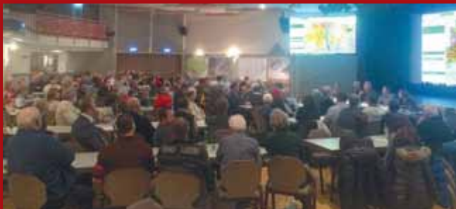
Zahlreiche interessierte Bürgerinnen und Bürger im großen Kulturhaussaal: An der Bürgerversammlung zur Vorstellung des neuen Flächenwidmungsplanes am 12. Dezember des Vorjahres herrschte sehr großes Interesse.