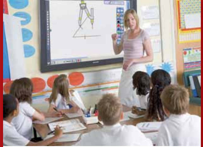
Multitouch-Displays werden mittlerweile gerne im Unterricht eingesetzt.