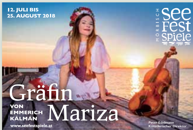
Die Seefestspiele in Mörbisch sind ein jährlicher Kulturhöhepunkt.

Eine übermütige Gräfin, ein erfundener Bräutigam und ein verarmter Graf – in Emmerich Kálmáns Operette „Gräfin Mariza“ gibt es allerhand amouröse Verstrickungen und eine Fülle grandioser Melodien.