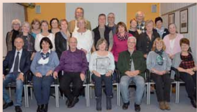
Das Klassenfoto wurde von Engelbert Weidhofer professionell gestaltet und man kann sehen wie gemütlich und lustig es war.

Es war wie früher eine Harmonie und Fröhlichkeit zu spüren, und das spricht für die sehr gute Klassengemeinschaft.