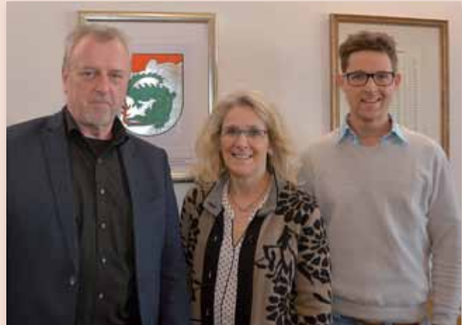
Die Sicherheitspartnerschaft mit Liezen wurde im Februar im Rathaus besiegelt.

Wenn die Polizei gerufen wird, ist es meistens schon zu spät. Werden negative Entwicklungen erkannt, kann durch Prä-