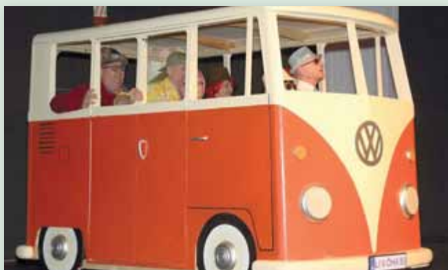
„Hop on-hop off Tour“ durch Liezen mit einem italienischen Touristenführer und internationalen Gästen: Attraktionen waren unter anderem die „Rosa-Sulzbacher-Radbrücke“ und die Lindwurm-Skulptur beim Eurospar-Kreisverkehr.

somit 106 Aktive der Faschingsgilde an den Narrenabenden mit. Ein besonderes Danke unseren musikalischen Vagabunden, die jeden Abend groß aufspielten, dem Team des Liezenerhofes für die tolle Bewirtung im Kulturhaussaal sowie für die vielen Werbeeinschaltungen heimischer Firmen! ■ Weitere Informationen gib'ts auf der Homepage unter www.faschingsgilde-liezen.at und auf Facebook.