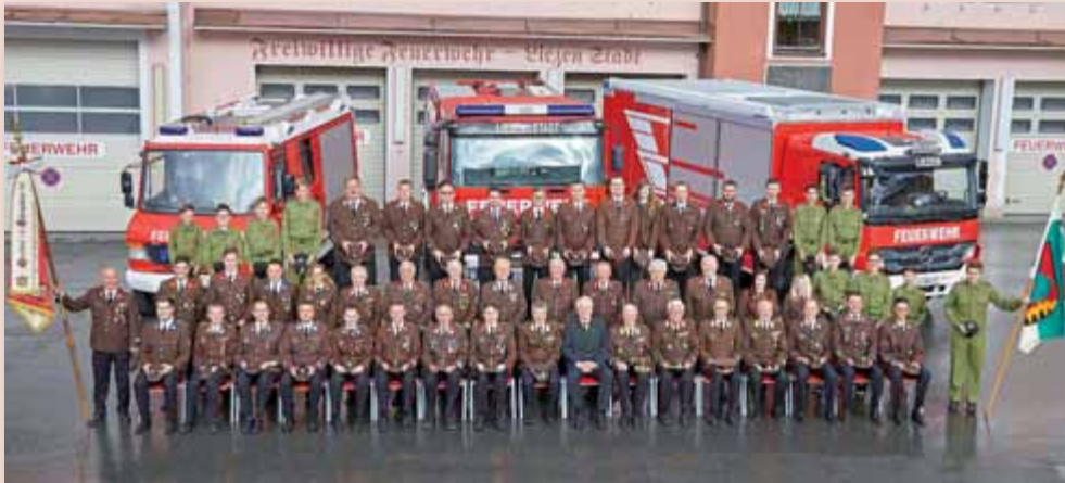
Das Team der Stadtfeuerwehr Liezen erbrachte im vergangenen Jahr knapp 13.500 freiwillige Stunden.

Das Feuerwehrwesen hat in Österreich einen besonders hohen Stellenwert und ist – ob seiner flächendeckenden und engmaschigen Gesamtheit – ein wesentlicher und unverzichtbarer Bestandteil unseres Sicherheitssystems.