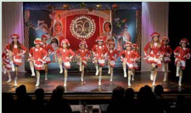
Wie jedes Jahr verzauberte die Minigarde das Publikum mit ihren Auftritten.

Sechs Mal waren die Narren der Faschingsgilde zu Liezen im heurigen Fasching auf der Bühne des Kulturhauses in Liezen. Die Zuseher waren jeden Abend begeistert und voll des Lobes.