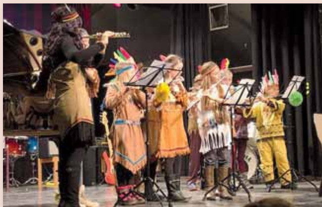
Lustige Kostüme, tolle Musikstücke und eine super Stimmung – das war das Faschingskonzert der Musikschule Liezen.

Instrumenten. Viel gelacht wurde über Karotten, die zu Flöten gebastelt und im Rahmen des Stückes verschmaust wurden. Das Publikum konnte einen amüsanten Musikabend genießen beschwingt nach Hause gehen.