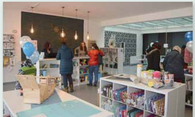
Schon am Eröffnungstag wurde das neue Sortiment gut angenommen.

Nähzubehör, Schnittmuster, Fachbücher und auch besondere Geschenkartikel.