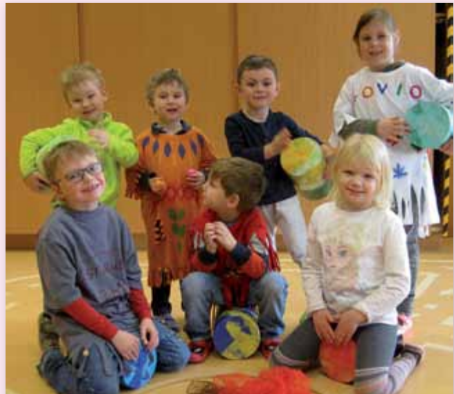
Das Indianerfest am Faschingsmontag war der Höhepunkt dieses Trommel-Projektes. Aber auch danach wird im Heilpädagogischen Kindergarten weitergetrommelt, denn ... Trommeln macht Spaß!

Der Umgang mit der Trommel wurde erarbeitet, doch im Vordergrund stand der Spaß am Zusammenspiel in der Gruppe, und so ganz nebenbei spürten die Kinder die Dynamik, erfuhren die unterschiedlichsten Klangfarben, sie spürten die Resonanz des Trommelfells, sie konnten Spannungen, Aggressionen, Ängste abbauen und erfuhren eigene Grenzen und die der anderen.