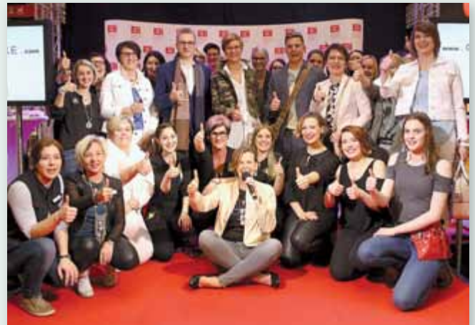
Schon die erste Auflage der Umstyling-Live-Show im vergangenen Jahr war ein voller Erfolg.

oder kennst du jemanden, der ein Umstyling verdient? Dann komm an den Event-Tagen ins ELI und mit viel Glück seid ihr mit dabei! Wir suchen Damen, Herren und Paare!