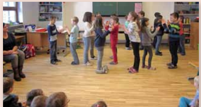
Die Kinder profitieren von den Angeboten in der Volksschule und sind mit viel Eifer und großer Freude dabei.

Die Volksschüler und Volksschülerinnen besuchen die Kinder in ihrer gewohnten Umgebung in ihren Kindergarten-Gruppen, erzählen, lesen vor oder schreiben Briefe an die Kindergartenkinder. Zusätzlich werden die Kindergartenkinder zu Aktivitäten und Angeboten in die Volksschule eingeladen. Dabei haben die zukünftigen Erstklässler die Gelegenheit die Schulkinder kennenzulernen, das Schulhaus zu erleben, Eindrücke über un-