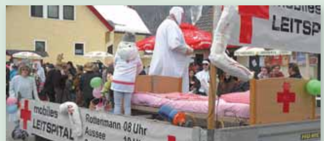
Mit dem mobilen Leitspital scheint die Lösung in der Standortfrage gefunden zu sein.