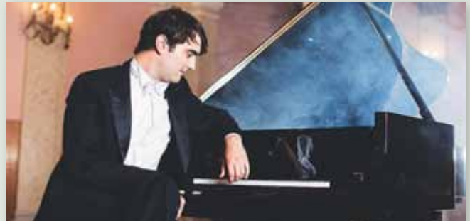
Freuen Sie sich auf zwei wunderbare Abende mit hervorragenden Interpreten.

Die beiden letzten Konzerte im Rahmen des Zyklus „Vier Jahreszeiten“ finden am 9. März und am 3. Mai im Kulturhaus statt.