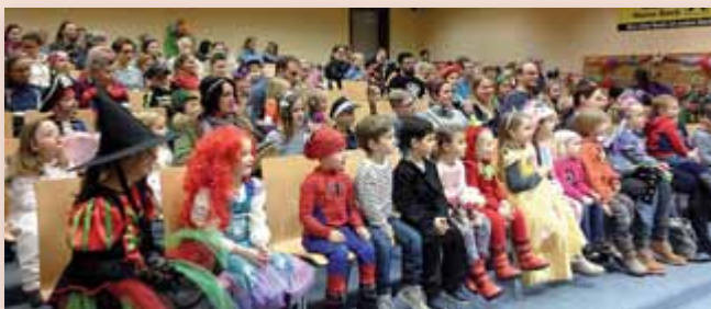
Fasching in der Bibliothek: Gebannt folgen die kleinen Gäste der Faschings-Zaubervorstellung.

Literatur wurde bereits angeschafft und hilft bei Aufbau und Herangehensweise bzw. beim wissenschaftlichen Arbeiten. Außerdem unterhält die Bibliothek Liezen Kontakte zu sämtlichen Öffentlichen und Wissenschaftlichen Bibliotheken Österreichs und kann somit bei der Literaturrecherche und -beschaffung behilflich sein.