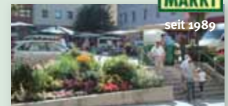
Alle Angaben ohne Gewähr!

■ Informationen über Eintrittspreise und Vorverkaufsstellen erhalten Sie beim Stadttamt Liezen/Bürgerservice unter der Telefonnummer 03612/22 881) oder auf www.liezen.at (Veranstaltungskalender).