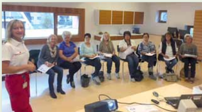
Die Damen des Gemeindehilfsvereins bilden sich laufend weiter, wie hier beim Erste Hilfe Kurs im Gemeindezentrum Weißenbach.

Der gemeinnützig geführte Verein besteht seit nunmehr 20 Jahren und fokussiert sich in seiner Arbeit in erster Linie darauf, ältere Menschen in der Bewältigung ihrer alltäglichen Arbeiten zu unterstützen.