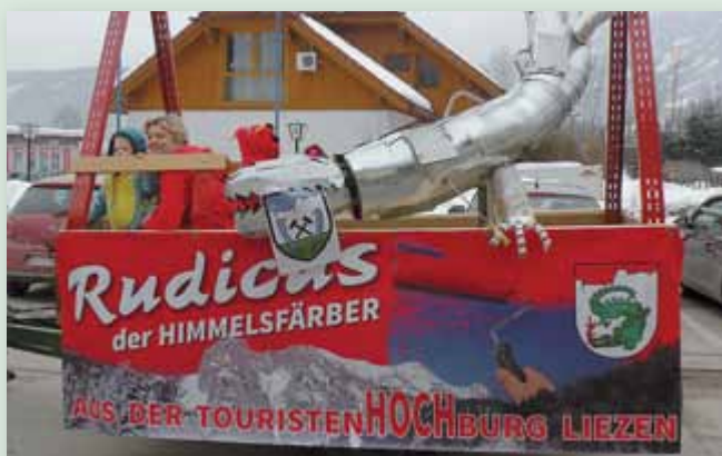
„Rudicus“, das Wappentier der TouristenHOCHburg Liezen, regt zu Diskussionen an.

Rund 15 Gruppen waren mit von der Partie. Auch unsere Neo-Bürgermeisterin war mit „Roswittchen und die roten Zwerge“ aktiv ins bunte Faschingstreiben eingebunden. In der närrischen Zeit ist es natürlich üblich, das Themen, die bewegen, humorvoll präsentiert werden.