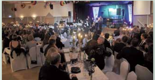
Der diesjährige Stadtball der SPÖ-Stadtpartei war restlos ausverkauft und die Stimmung grandios.

Im Kulturhaus wurde beim traditionellen Stadtball der SPÖ Liezen wieder kräftig das Tanzbein geschwungen!