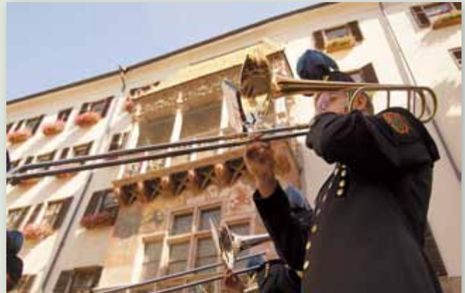
Wie schon 2015 wird der Musikverein Liezen die Steiermark bei den Promenadenkonzerten vertreten und unter dem goldenen Dach das Publikum begeistern.

9.00 Uhr: Deutsche Messe von Franz Schubert Heilige Messe mit Bischof Hermann, Hofkirche 10.30 – 12.00 Uhr: Klangwolke in Grün-Weiß, Promenadenkonzert, Hofburg Innsbruck (Open Air)