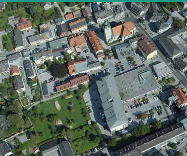
Das innere Kerngebiet der Stadt Liezen aus der Luft betrachtet.

■ Für detaillierte Informationen besuchen Sie die Websites www.masseur-peter.com und www.olga4u.at