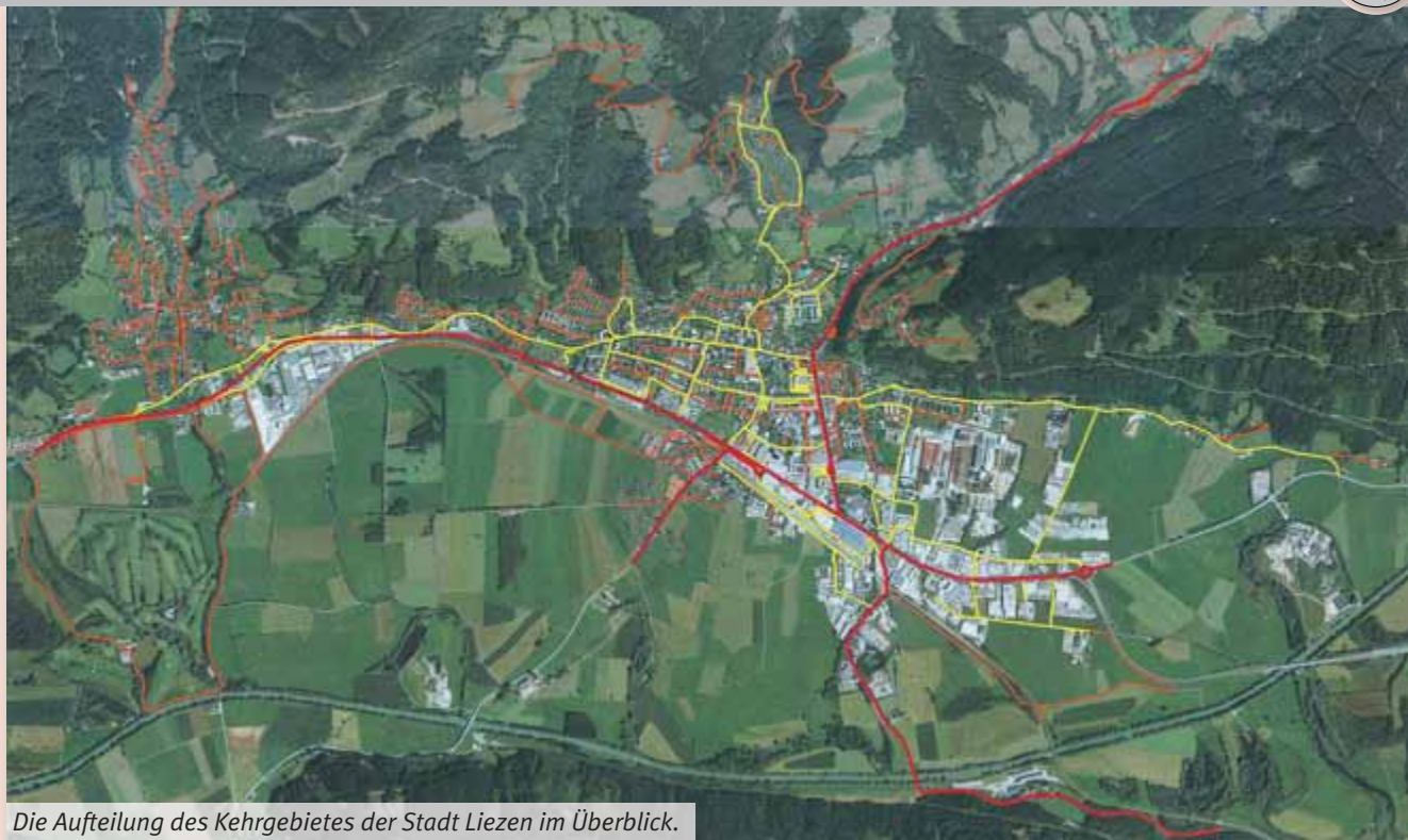
Die Aufteilung des Kehrgebietes der Stadt Liezen im Überblick.