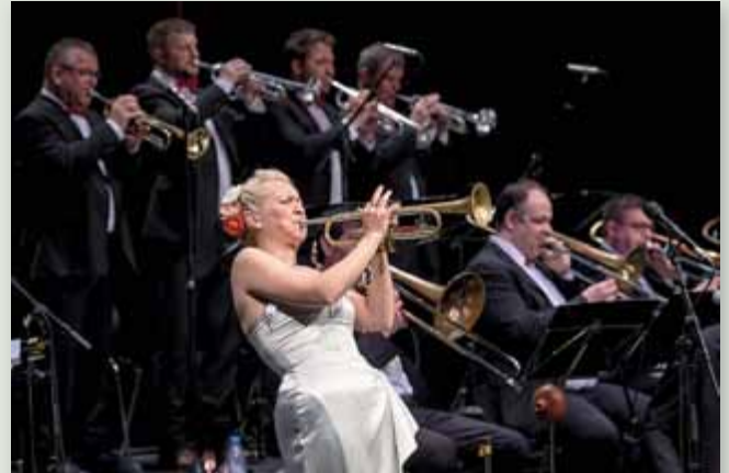
Gunhild Carling wird auch das Liezener Publikum faszinieren.

■ Weitere Infos und Videos auf www.lungaubigband.com und www.gunhildcarling.net