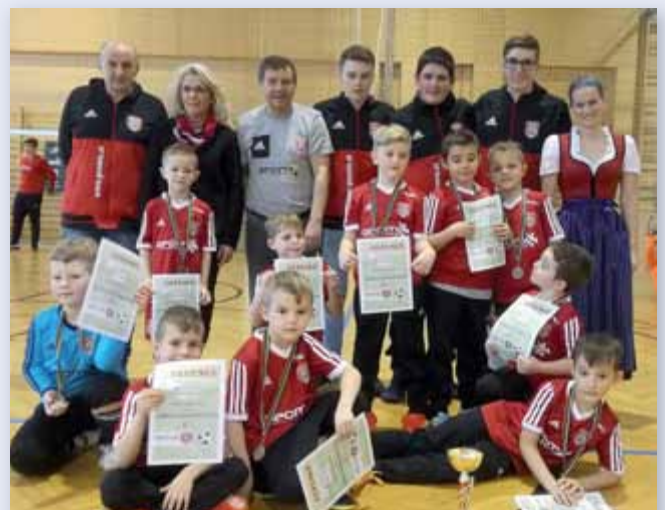
Die erfolgreichen Jungsportler präsentieren stolz ihre Urkunden.