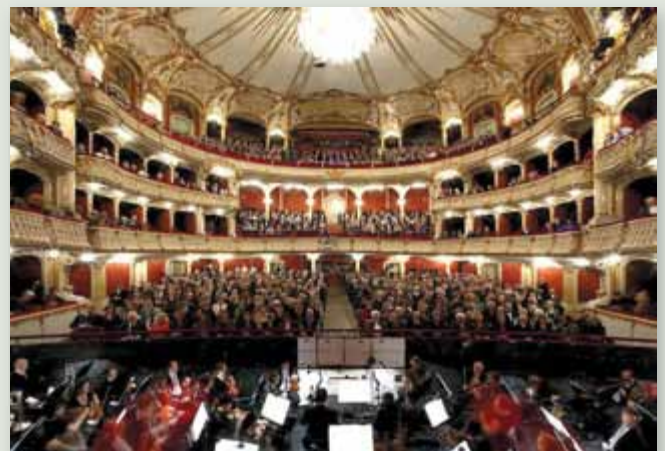
Mit einem Abo der Oper Graz regelmäßigen Kulturgenuss erleben.

Das Kulturreferat der Stadt Liezen organisiert jedes Jahr Fahrten zu Aufführungen in die Oper Graz, und zwar im Sonntag-Nachmittag-Abonnement.