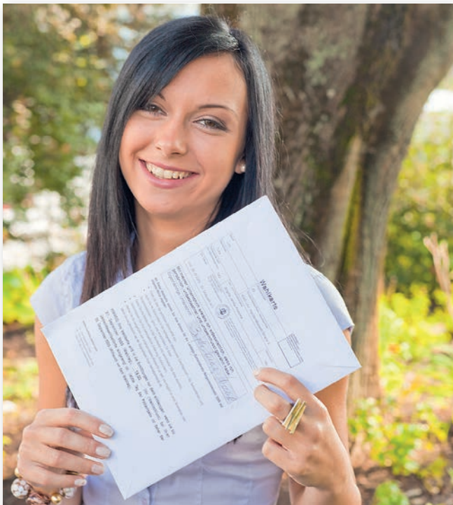
Eine telefonische Beantragung der Wahlkarte ist nicht möglich!

Einen Wahlkartenantrag können Sie bis zum 20. November 2019 schriftlich (online, per E-Mail oder Fax) oder bis zum 22. November 2019, 12.00 Uhr, persönlich bei der Stadtgemeinde Liezen stellen.